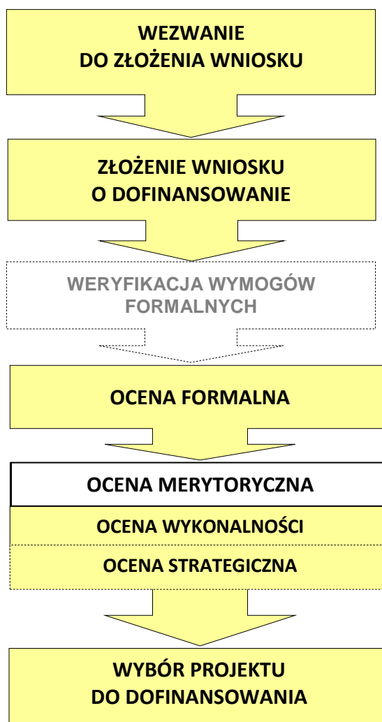
Rys. 2. Schemat wyboru projektów w ramach RPO WP (tryb pozakonkursowy).

W trybie pozakonkursowym wnioski o dofinansowanie projektów składane są na wezwanie IZ RPO WP przez podmioty uprawnione (tj. wskazane w Wykazie ) w terminie określonym przez IZ RPO WP, spójnym z przewidywanym terminem złożenia wniosku o dofinansowanie zamieszczonym w Wykazie .